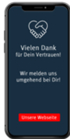
Seite 5 Sendebestätigung