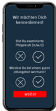
Seite 1-3 Fragenkatalog