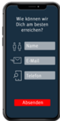
Seite 4 Kontaktformular