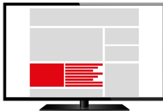
Native Content Teaser