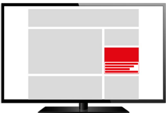
Native Teaser Ad